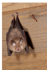
Kleine Hufeisennase ( Rhinolophus hipposideros ) 2