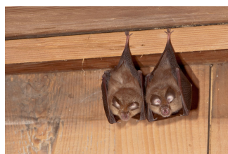
Kleine Hufeisennase ( Rhinolophus hipposideros ) 3