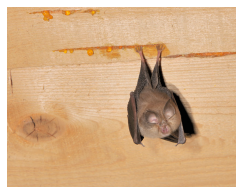
Kleine Hufeisennase ( Rhinolophus hipposideros ) 4